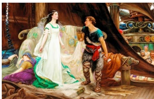
Tristan et Iseult Herbert James Draper (1863-1920)

tarif E durée : 4h40 dont deux entractes ; chanté en allemand, surtitré en français