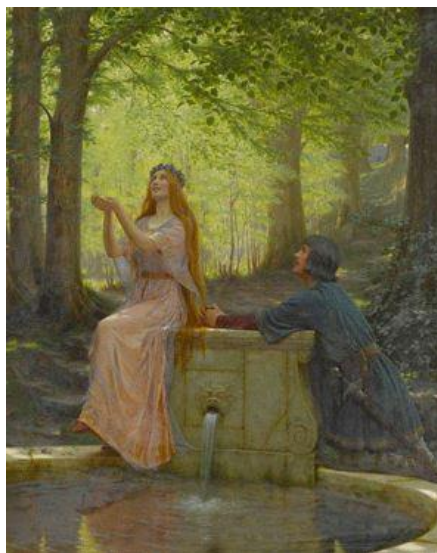
Pelléas et Mélisande peint par Edmund Blair Leighton (1853-1922)

Les Siècles, François-Xavier Roth – Daniel Jeanneteau ; mercredi 24 et vendredi 26 mai, à 20h ; tarif E durée : 3h entracte inclus ; chanté et surtitré en français ; livret de Maurice Maeterlinck (1862-1949)